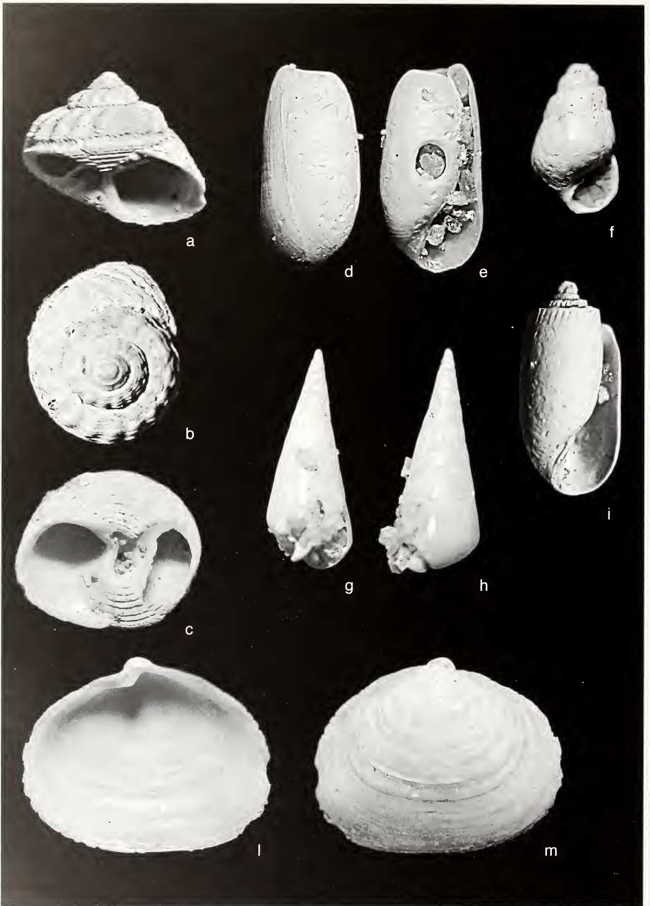
Fig. 3. a-c. Gibbula semirotonda SACCO, 1896, larghezza 9,0 mm, d, e. Cylichnina crebrisculpta Monterosato, 1884, altezza 2,0 mm, f. Odostomia lukisii Jeffreys, 1859, altezza 1,6 mm, g, h. Melanella cf. frielei (Jordan, 1895), altezza 3,2 mm, i. Acteocina knockeri (Smith E.A., 1872), altezza 2,0 mm; l, m. Spaniorinus farnesiniana (Cerulli-Irelli, 1908), lunghezza antero-posteriore 3,0 mm.